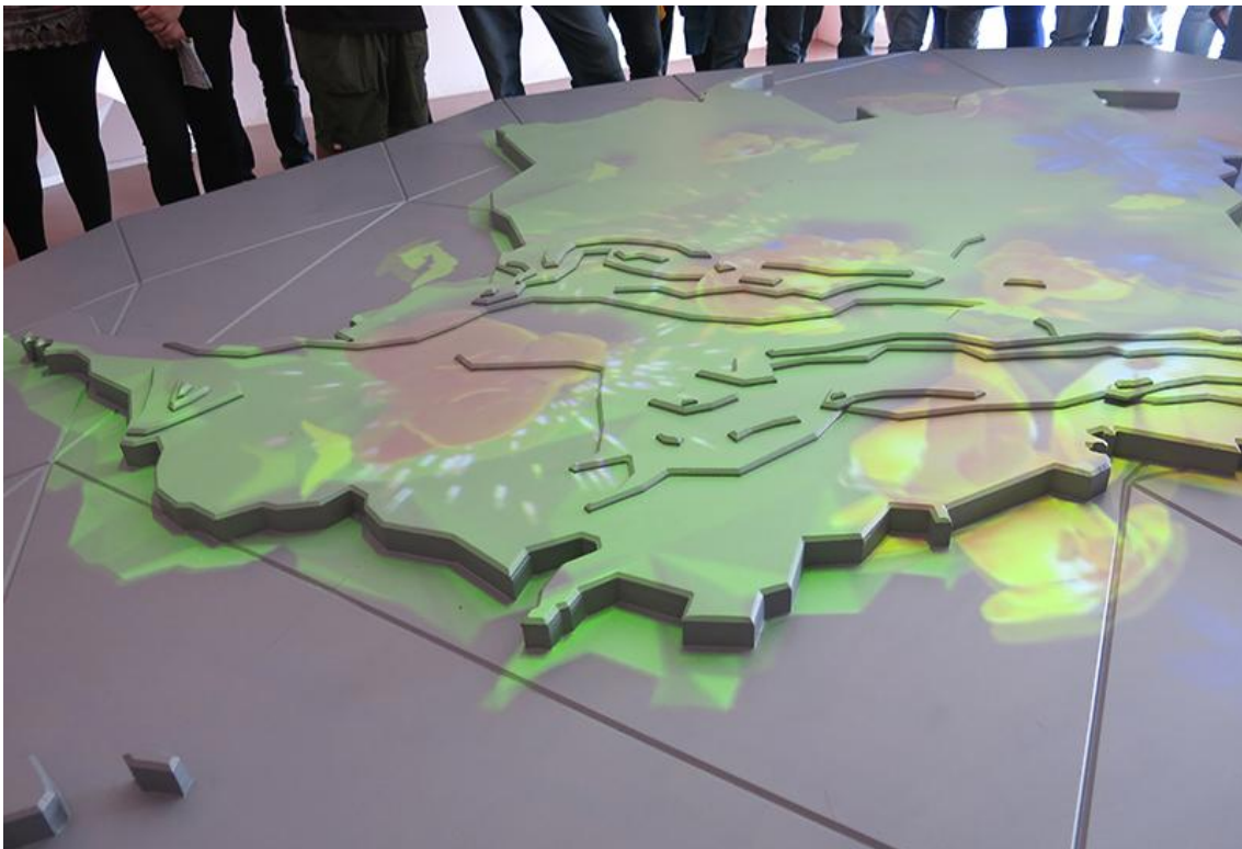
Fig.5. Pabellón Expomilán, Diseño por Yemail Arquitectura. Mayo de 2015.

Propuesta: Cartografía de Colombia en planos seriados con proyección que muestre la evolución de la presencia de Coomeva en el territorio nacional.