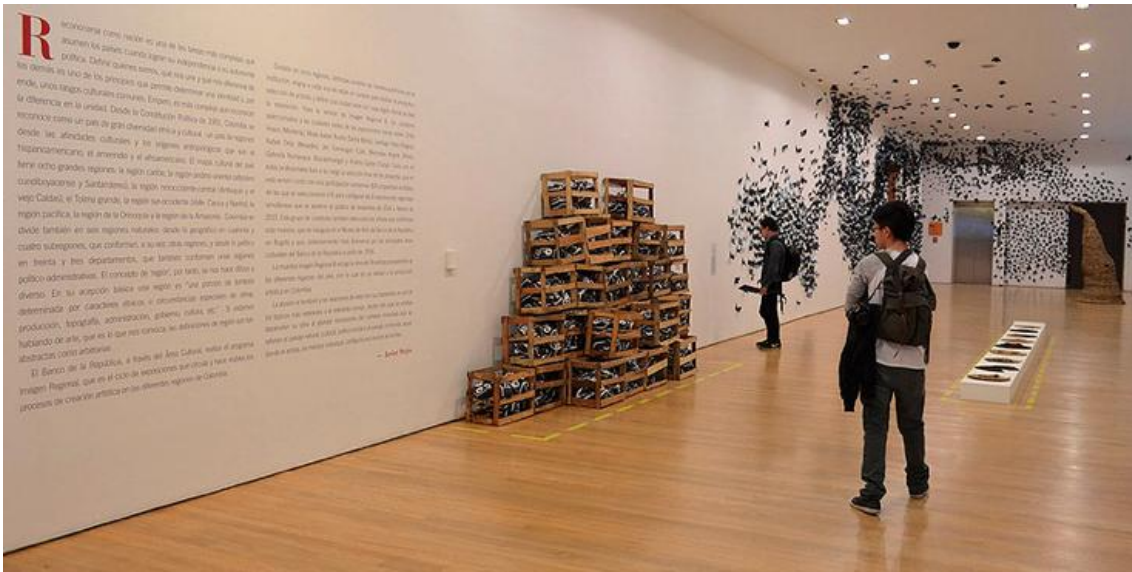
Fig. 1. Imagen Regional 8, Museo de Arte del Banco de la República. Bogotá, Colombia.