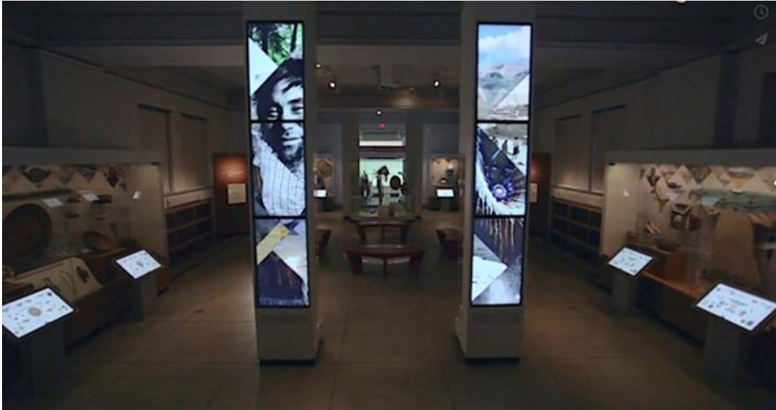
Fig.4. Dispositivos táctiles Museo Penn. Museum of Archaeology and Anthropology. Pennsylvania, Estados Unidos Tomado de: Interior de la sala http://www.penn.museum/

Propuesta: Cartografía de Colombia en planos seriados con proyección que muestre la evolución de la presencia de Coomeva en el territorio nacional.