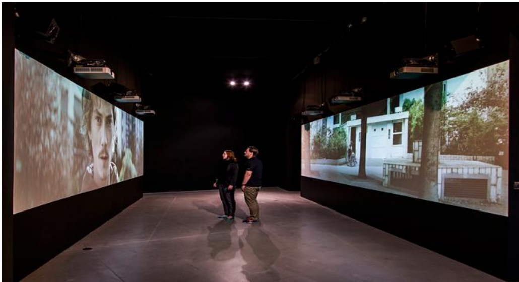
Fig.3. Proyección, Museo ARoS Aarhus Kunstmuseum, Dinamarca.

Propuesta: Video donde sea incluido los testimonios de manera corta de los fundadores, tipo clip, testimonios de 2 minutos máximo a cámara cada uno; se podría proyectar el video en una pantalla Led con auriculares.