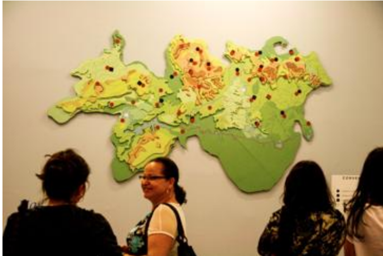
Fig.6. Cartografías de un mundo conocido de Vanessa Sandoval. Becas de creación Bloc 2014, Sala Alterna Museo La Tertulia. Cali, Colombia.