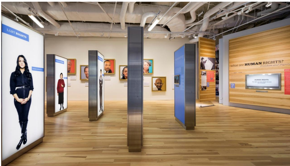
Fig.7. National Center for Civil and Human Rights. Diseño por David Rockwell.

Propuesta: Fotografías impresas a tamaño real con frases y testimonios de personas que hacen parte de la comunidad Coomeva, principalmente sus distintos grupos de asociados.