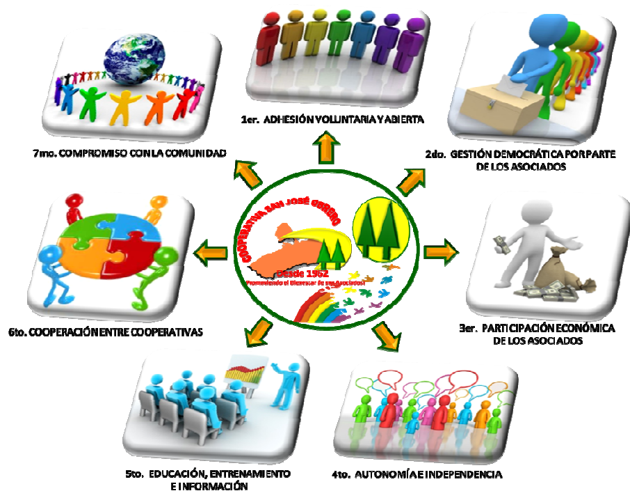
Fig. 5: Principios Universales del Cooperativismo.

CONCLUSIONES: Con todo el estudio realizado, teniendo en cuenta los hechos cumplidos según los argumentos aportados, así como las vivencias y experiencias recopiladas a lo largo de casi 50 años de existencia de la Cooperativa, me permito dejar a consideración las siguientes conclusiones sobre el tema de la Ponencia planteada.