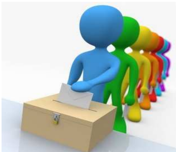
Fig. 6: Elecciones, Sufragios y Escrutinios.