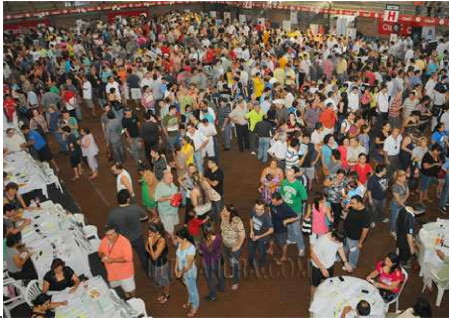
Fig. 3: Democracia y Participación en las Cooperativas.

El ejercicio de la Democracia, asumido con responsabilidad, se transforma en la Máxima Demostración de LIBERTAD y CULTURA POLÍTICA . Se observa de manera comprensible, en el derecho que le asiste al Asociado, de participar en la TOMA DE DECISIONES para nuestra Empresa.