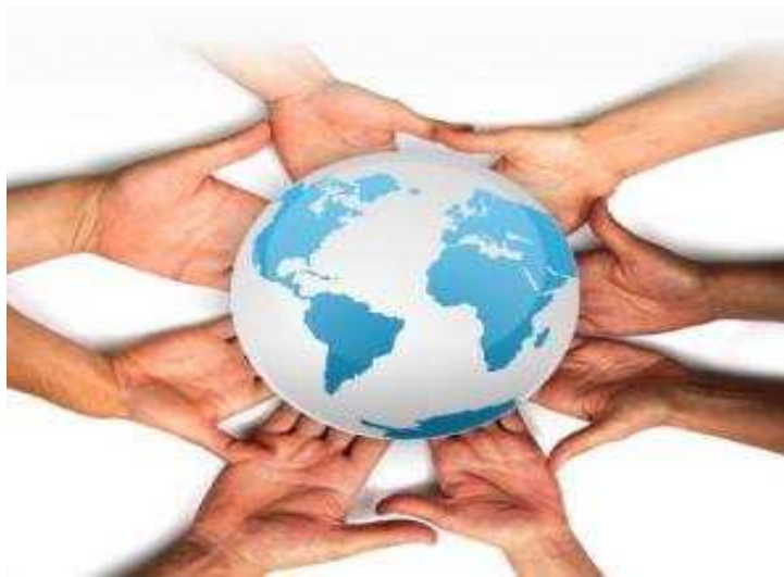
Fig. 8: Valores Universales de las Cooperativas.

ONU, 2012 AÑO INTERNACIONAL DE LAS COOPERATIVAS. Segundo Objetivo Principal:"Promover el crecimiento de cooperativas compuestas por personas e instituciones, para abordar sus necesidades económicas mutuas, además de lograr una plena Participación económica, social y democrática. Las cooperativas están basadas en los valores de la Autoayuda, la Autoresponsabilidad, la Solidaridad, la Igualdad, la Equidad y la Democracia ".