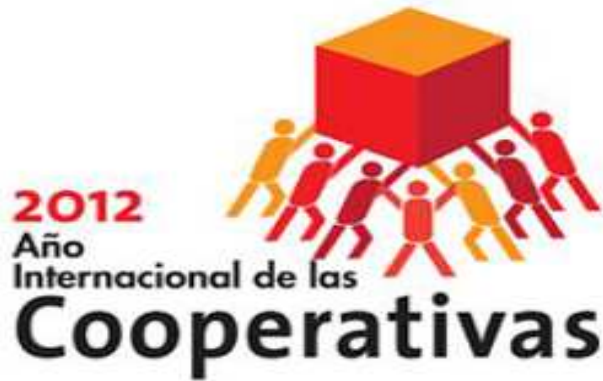
Fig. 2: Año Internacional del Cooperativismo.

“ CONSTRUIMOS NUESTRA RUTA IDEOLÓGICA, SOBRE LA VOLUNTAD DE LOS ASOCIADOS A NUESTRA COOMEVA.”