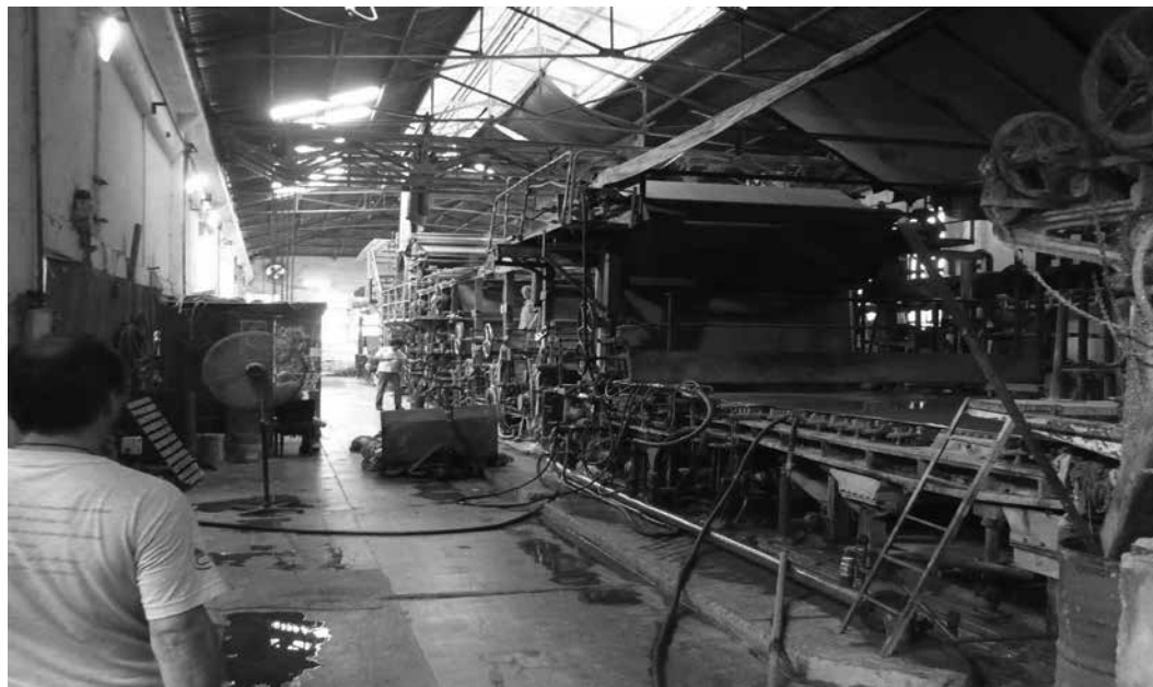
Papelera Industrial de La Plata, ex San Jorge. Maquinarias principales para producir papel.