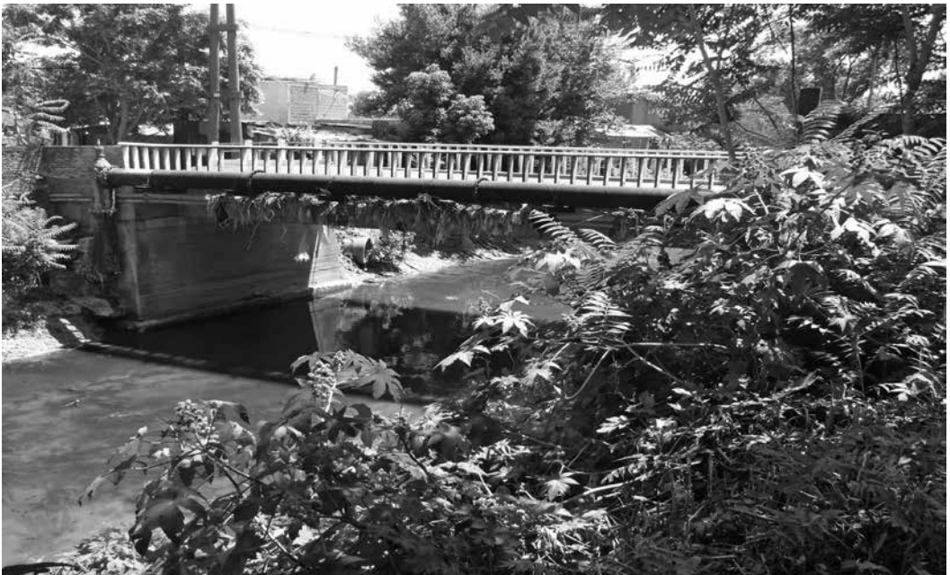
Arroyo que es contaminado por la Papelera Industrial.