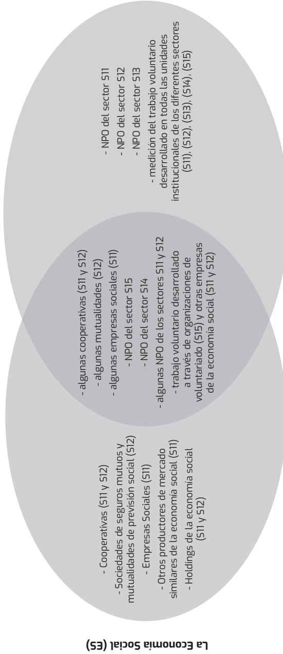
Gráfico 1. Dos campos diferentes de observación: la Economía Social (ES) y el Non-Profit and Related Institutions and Volunteer Work